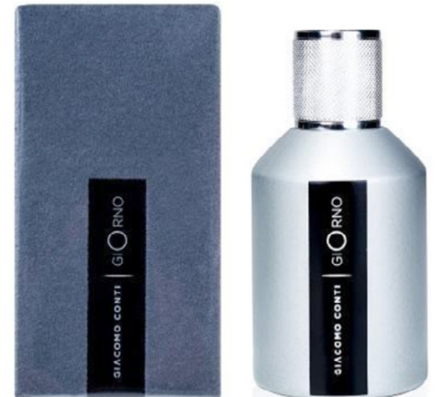
GC Giorno Premium