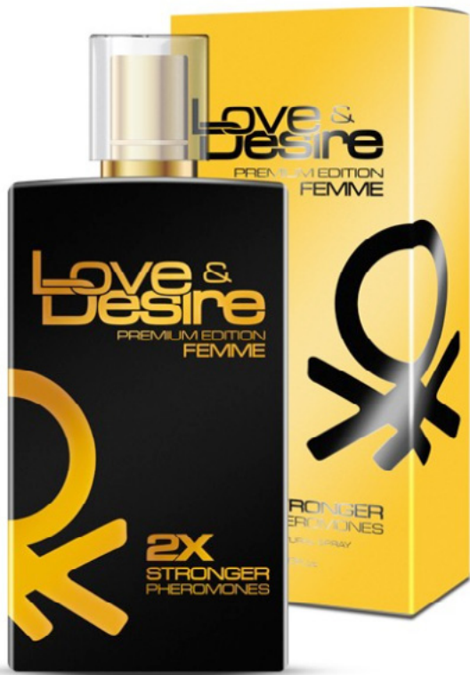
L&D Gold Premium